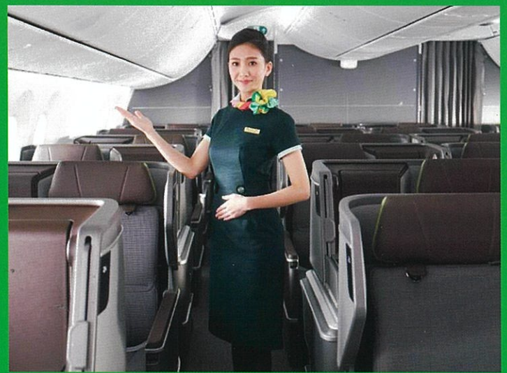
フレンドリーなサービス(イメージ)