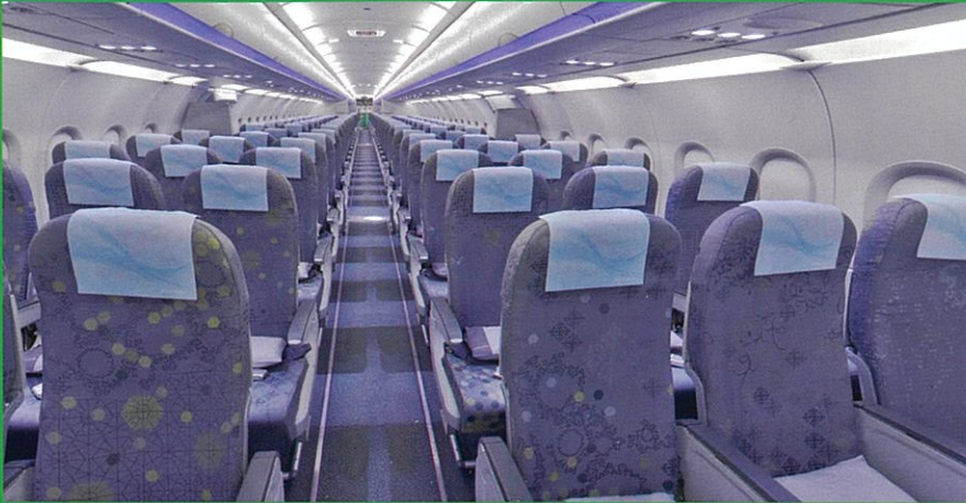
エコノミー(イメージ)

小松⇄台北間 主な使用機材：A321-200 ビジネス：8席(2-2), エコノミー：176席(3-3の配列)