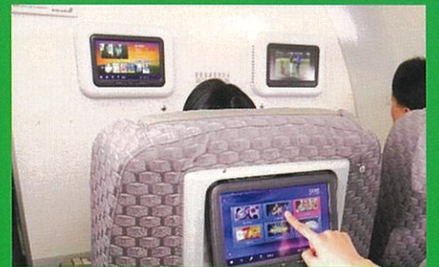
ビジネス(イメージ)