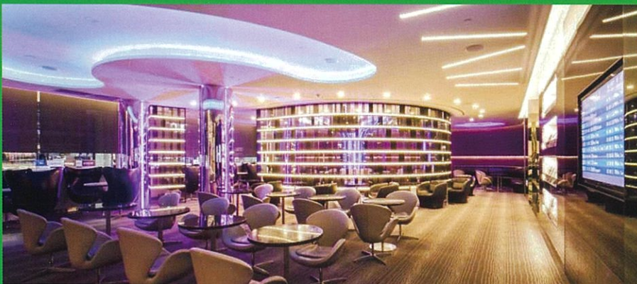
ビジネスラウンジ台北(イメージ)