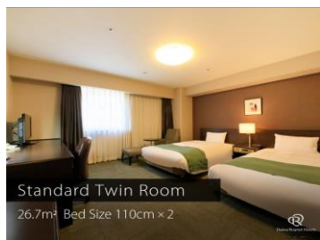
Standard Twin Room 26.7㎡ Bed Size 110cm×2