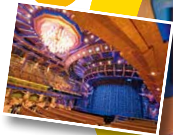
シアター 1,300名収容のシアターでは、 様々なエンターテイメントショーを 鑑賞出来ます。